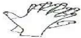
2.手指交错掌心对手背搓